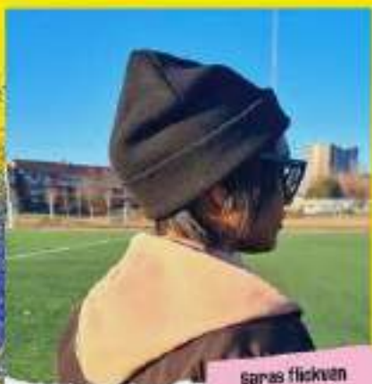
Saras flickvän tog sitt liv.

"Jag skulle önska att det fanns rum där man inte behövde förklara eller tvingas rätta andra eller känna sig förminskad. Att få dela och lyssna till de gemensamma erfarenheterna som ett sätt att börja läka."